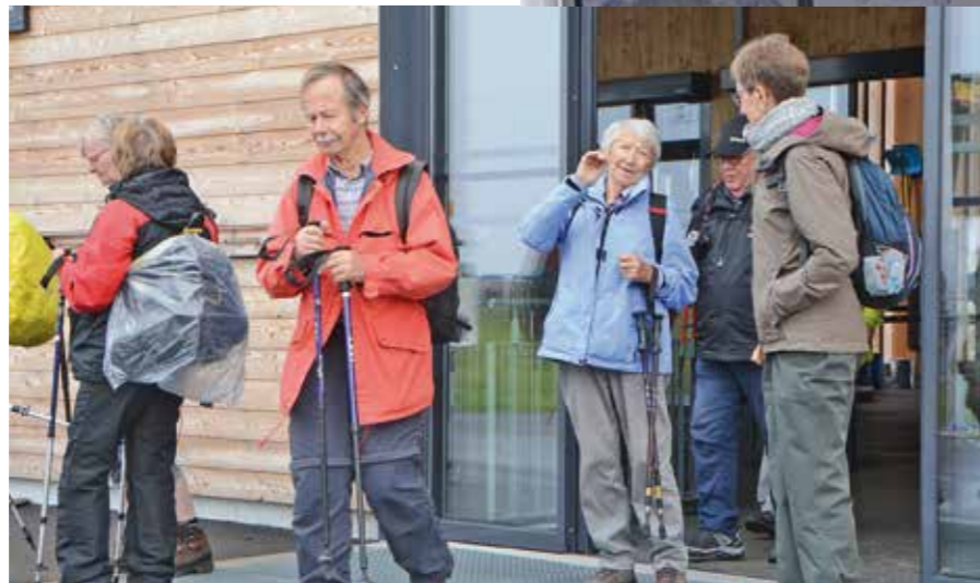
Start zur Wanderung trotz regnerischem Wetter auf dem Männlichen.