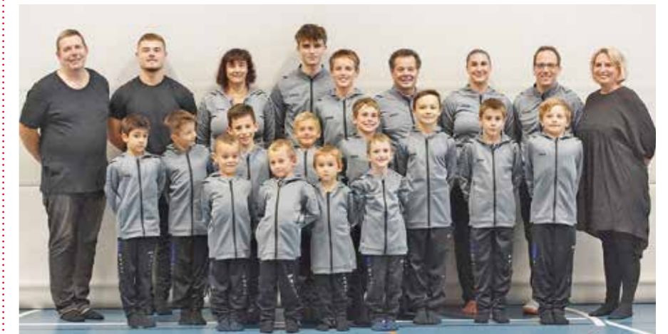
Stolz präsentieren die «Orianer» ihre neue Kleidung.