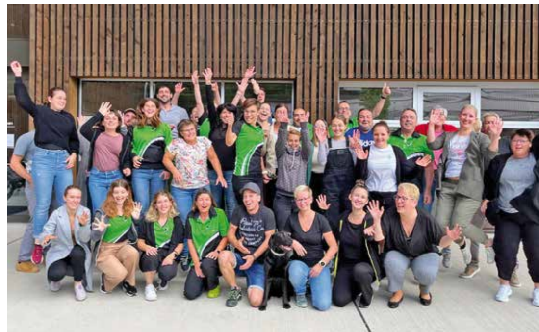
Gruppenbild der Teilnehmenden.