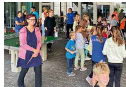
Erklärung der Posten.

geführt wurde. Die Teilnehmenden konnten sich in den Disziplinen Hindernislauf, Büchsenwerfen, Trottinettparcours, «Weitsprung aus dem Stand» oder «Ball an die Wand» messen. Unter tosendem Applaus wurden noch ein Pendellauf und ein «Maxi Brennball» gespielt. Witzig fanden es die Kinder, wenn sie bessere Resultate hatten als ihre Eltern. Zusammenfassend haben sich alle enorm angestrengt und mitgefiebert. Es sind aber nicht die guten Noten oder die Medaillen, welche in Erinnerung bleiben. Sondern viel mehr die gemeinsame Zeit, welche vollumfänglich genossen wurde. Das Plus in «Funparade+» steht übrigens für unsere lieben Eltern, dem SATUS Gümligen und die Zeit, welche wir alle zusammen geniessen durften. Simeon Jordi