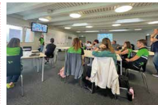
Workshop zum Thema Sozialkompetenz.

Am ersten Tag der zweitägigen Ausbildung wurde gemeinsam die Vision 2030 diskutiert und Werte des Vereins geschärft. Im Anschluss lernten die Anwesenden in theoretischen und praktischen Anwendungen viel Spannendes zum Thema Kommunikation. Es wurde viel geredet, gelacht, diskutiert und es kamen sehr spannende Ideen zu Tage. Nach einem intensiven Tag folgte der erfrischende Apéro auf dem Gelände des Gränicher Werkhofs. Im Anschluss wurde