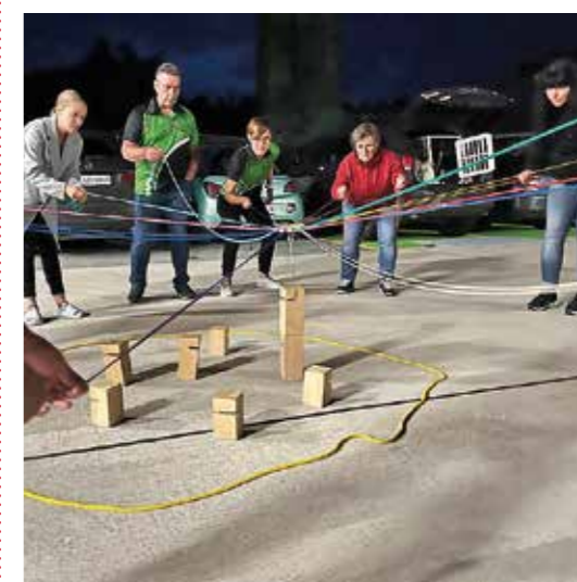
Vereint beim Teamspiel.