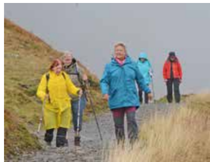
Es gibt kein schlechtes Wetter, wenn man die richtige Bekleidung hat.