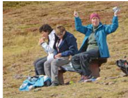
Auch beim Pick-nick herrschte eine gelöste Stimmung.