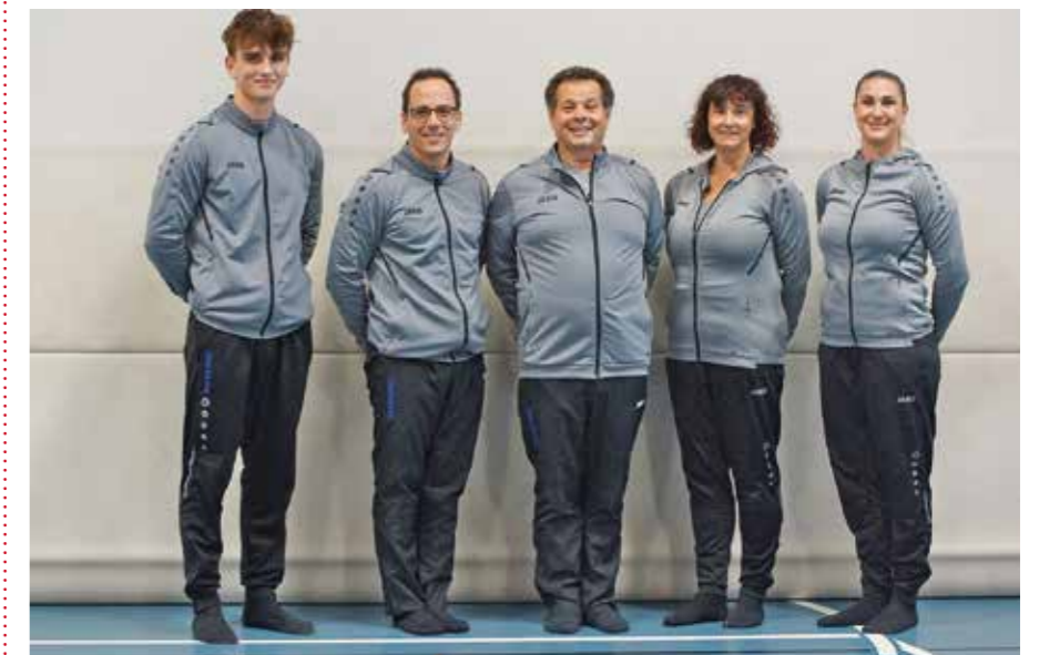
Das Leiterteam des SATUŠ ORO.