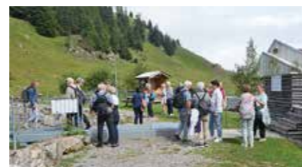
Spaziergang um das Stoos-Seeli.